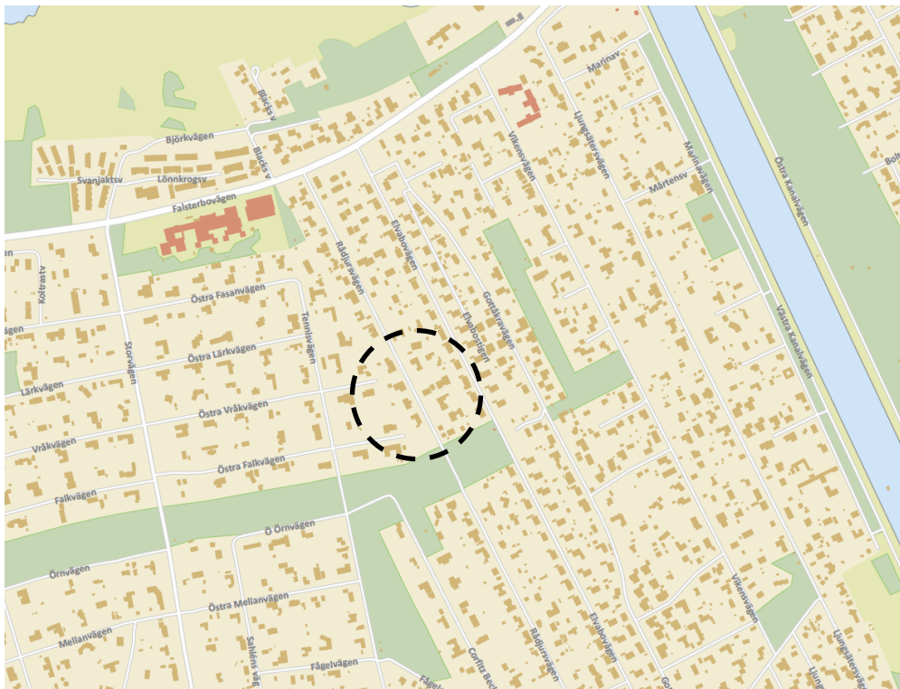
Översiktskarta med området som omfattas av detaljplanen i svart cirkel