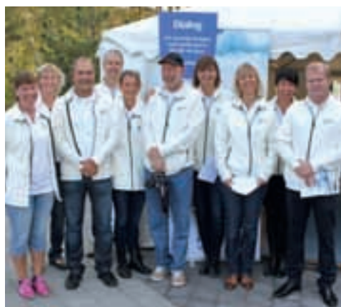
Några av de förtroendevalda och tjänstemän som deltog i Fexmässan på Falsterbo Strandbad den 25 september i strålande sensommarvärme.